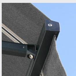
Standard frontprofil med kapp.